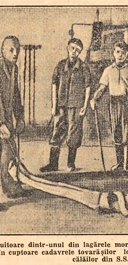
O scenă zguduitoare dintr-unul din lagărele morții hitleriste. Deținuții sînt forțați să arunce în cuptoare cadavrele tovarășilor lor, victime ale schinguirilor călăilor din S.S.

Prorector al Universității „Bolyai“-Cluj