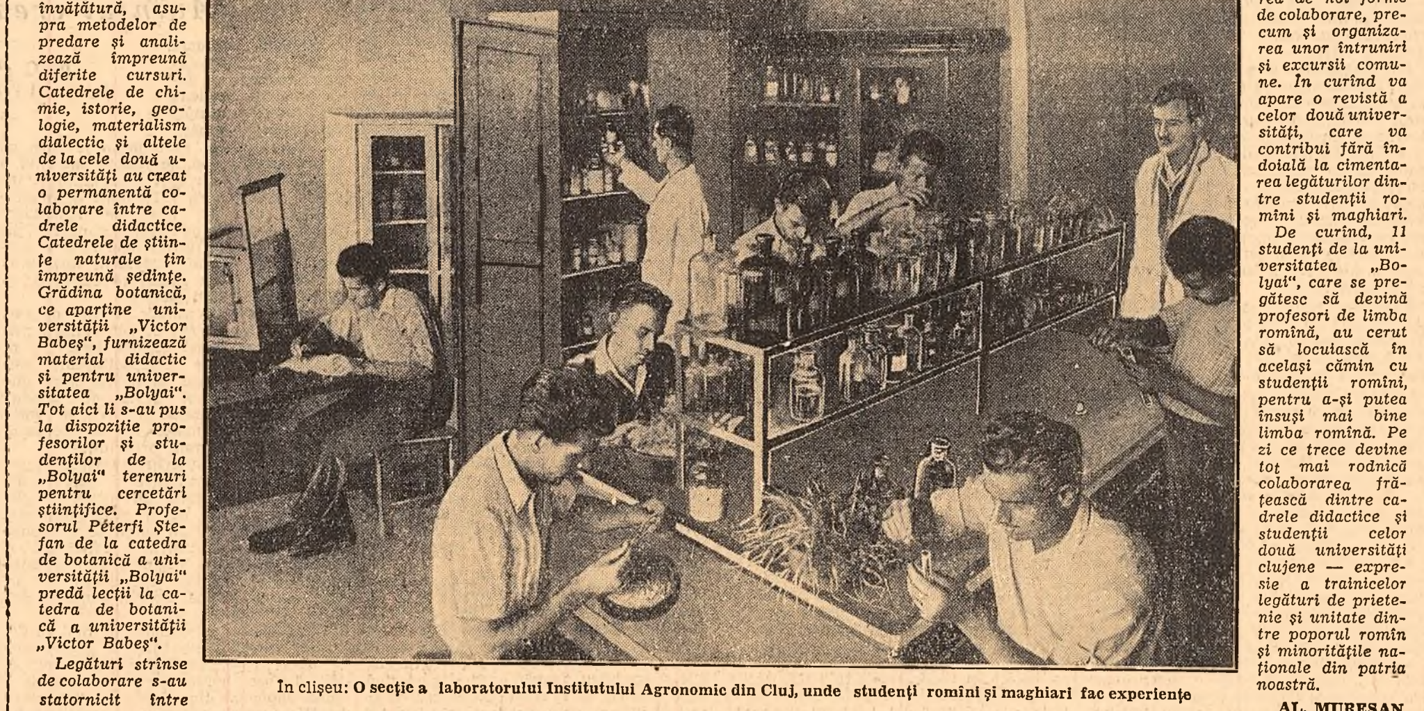
In clișeu: O secție a laboratorului Institutului Agronomic din Cluj, unde studenți romîni și maghiari fac experiențe