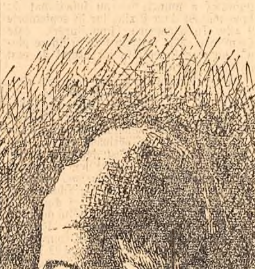
Desen în peniță, executat de scriitorul Barbu Delavrancea

Pann a fost primul folclorist romin. Deci culegeri de proverbe mai fuseseră împrățiate, ele n-au valoarea artistică necesară pentru a le putea reține.