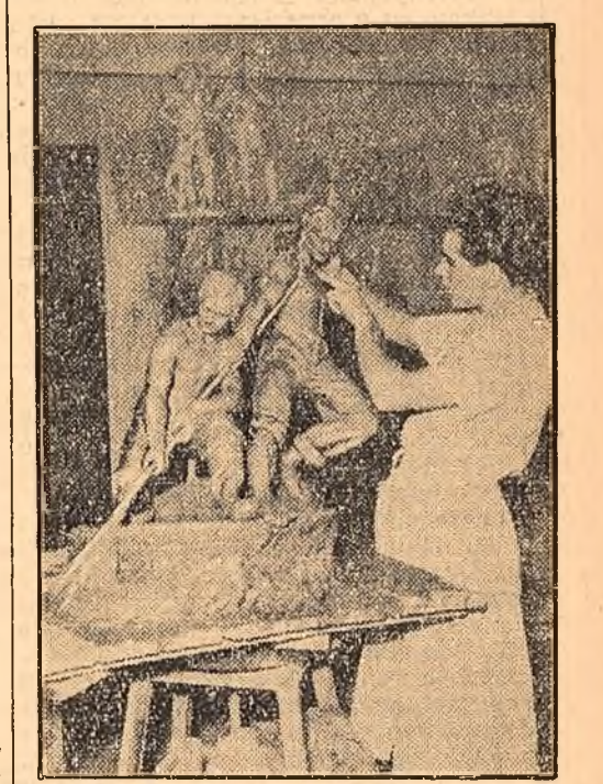
La Tg. Mureș funcționează o școală medie de arte plastice. Numeroși tineri talentați urmează cursurile acestei școli. În clișeu: În atelierul de sculptură al școlii, un elev lucrînd la un grup plastic.