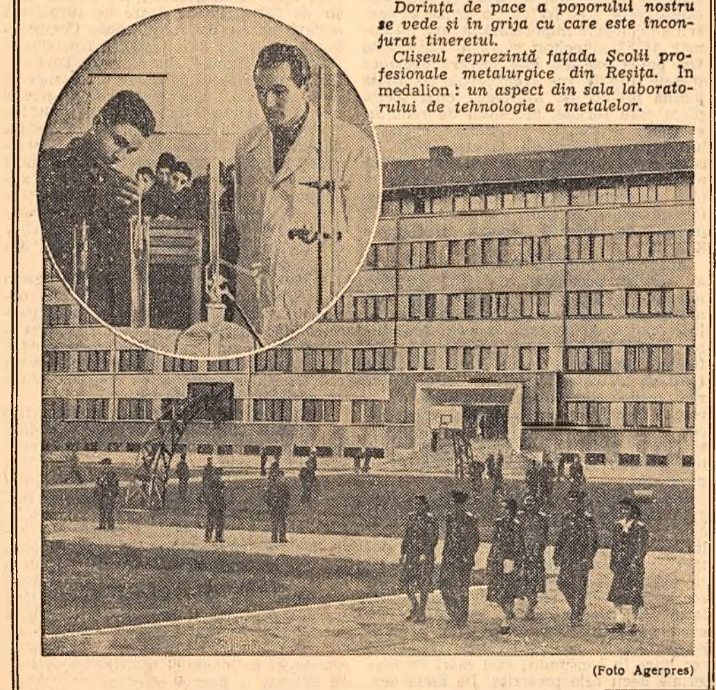
Dorința de pace a poporului nostru se vede și în grija cu care este înconjurat tineretul.