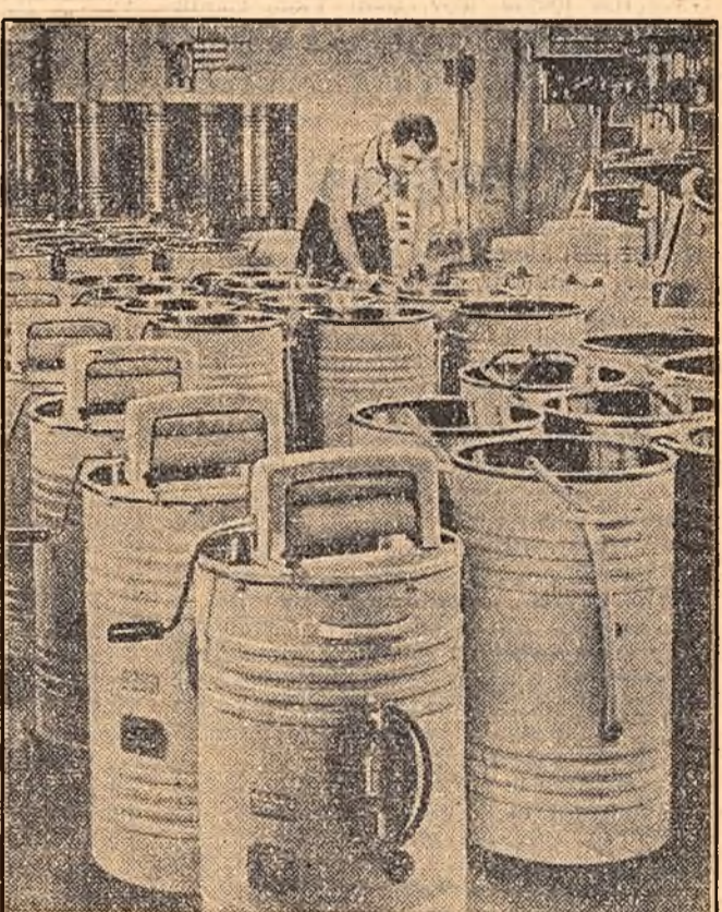
Grija pentru ușurarea muncii gospodinelor se vădește în sortimentul larg al producției bunurilor de consum popular.