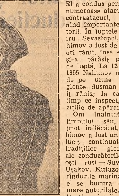
Amiralul Pavel Stepanovici Nahimov, strălucit continuator al celor mai bune tradiții ale artelor militare navale ruse.