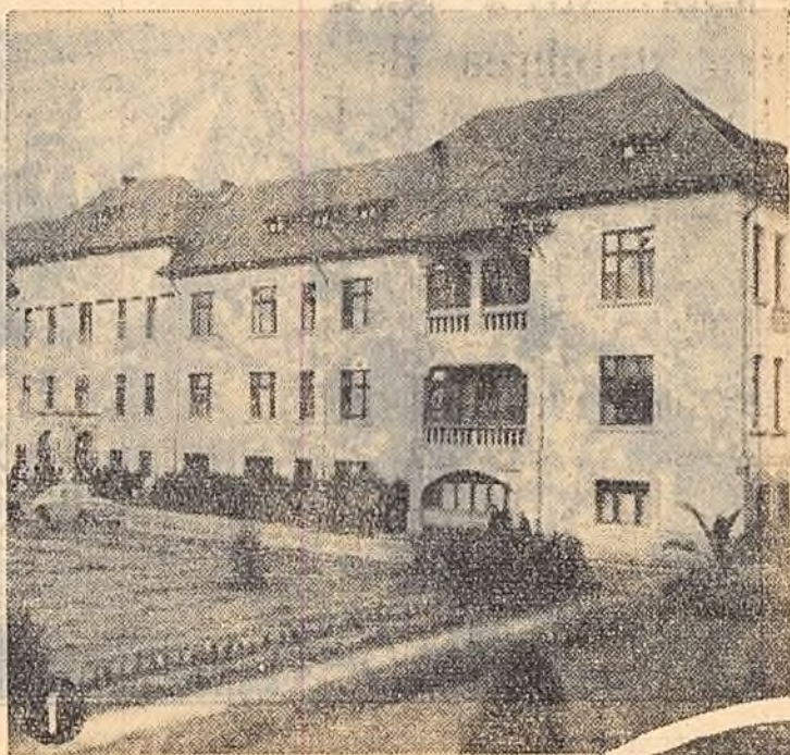
1. Cei ce muncesc au dreptul la asistența medicală gratuită. În anii regimului democrat-popular s-au înființat numeroase spitale, poli-clinici, dispensare, case de noștere, deservite de personal medico-sanitar calificat și înzestrate cu aparatură modernă. În cliseu: Clinica nouă chirurgicală din Tg. Mureș.

Se împlinesc trei ani de cînd Marea Adunare Națională a votat Constituția R. P. R. Marea lege a patriei noastre consfințește drepturile și libertățile cucerite de poporul muncitor în anii puterii populare, sub conducerea partidului. Ea asigură deplina exercitare a drepturilor cetățenești. Pe temeiul Constituției s-au înfăptuit noi și noi realizări. Oamenii muncii de la orașe și sate, dornici să dezvolte cuceririle dobîndite, își iau angajamentul, cu prilejul aniversării Constituției, să aperse și să consolideze drepturile de care se bucură, să lupte cu tot mai mult succes pentru construirea socialismului și îmbunătățirea necontenită a nivelului de trai.