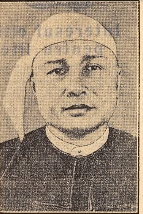
U Nu, primul ministru al Uniunii Birmane, în vizită la Moscova.