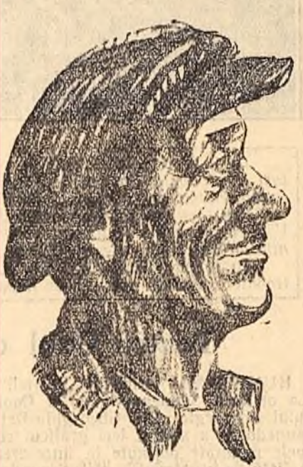
MIHAI MATEIAS tractorist fruntaș de la S.M.T.-Gottlob

Colectivității din Uihieu prețuiesc mult pe președintele gospodării lor. Datorită conducerii sale pricepute, colectivității muncesc tot mai bine și obțin an de an recolte bogate. În anul acesta, ei au cules de pe fiecare ha. cite 1.910 kg. grâu, 20.000 kg. sfeclă de zahăr, 3.500 kg. porumb etc., cu mult mai mult decît țărăni muncitori cu gospodării individuale din sat.