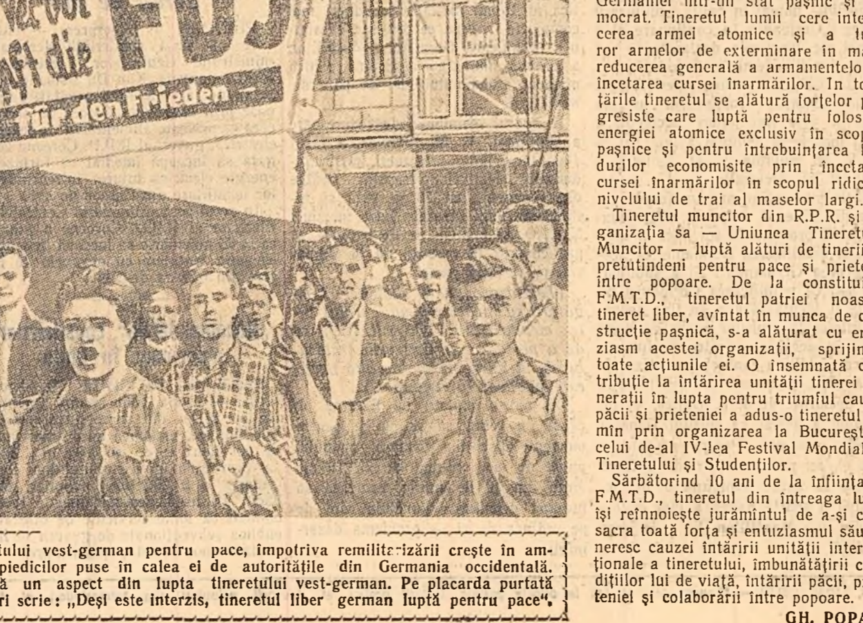
Lupta tineretului vest-german pentru pace, împotriva remilitarizării crește în amploare, în ciuda pedicilor puse în calea ei de autoritățile din Germania occidentală.