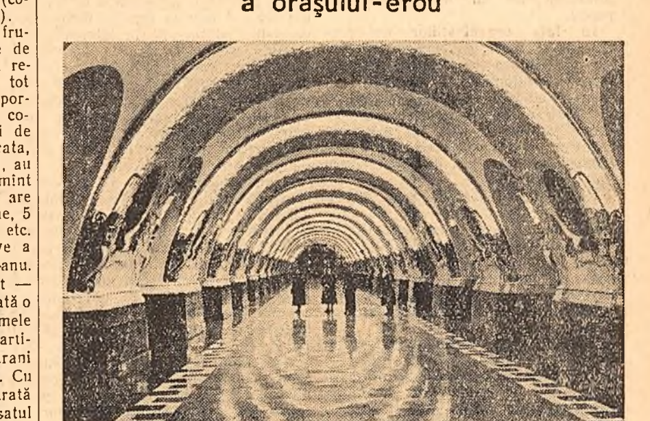
În cadrul unui miting festiv a fost inaugurată la 15 noiembrie 8 stații ale acestui linii sînt adevărate opere de artă. După prima călătorie cu metroul, leningrădenii au notat în cartea de impresii: „Ne mîndrim cu această mareă construcție!”, „Mulțumim constructorilor”, „Am primit un dar minunat!”