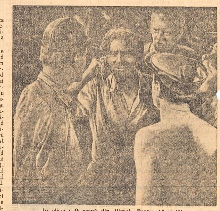
In clișeu: O scenă din filmul „Pentru 14 vietii”