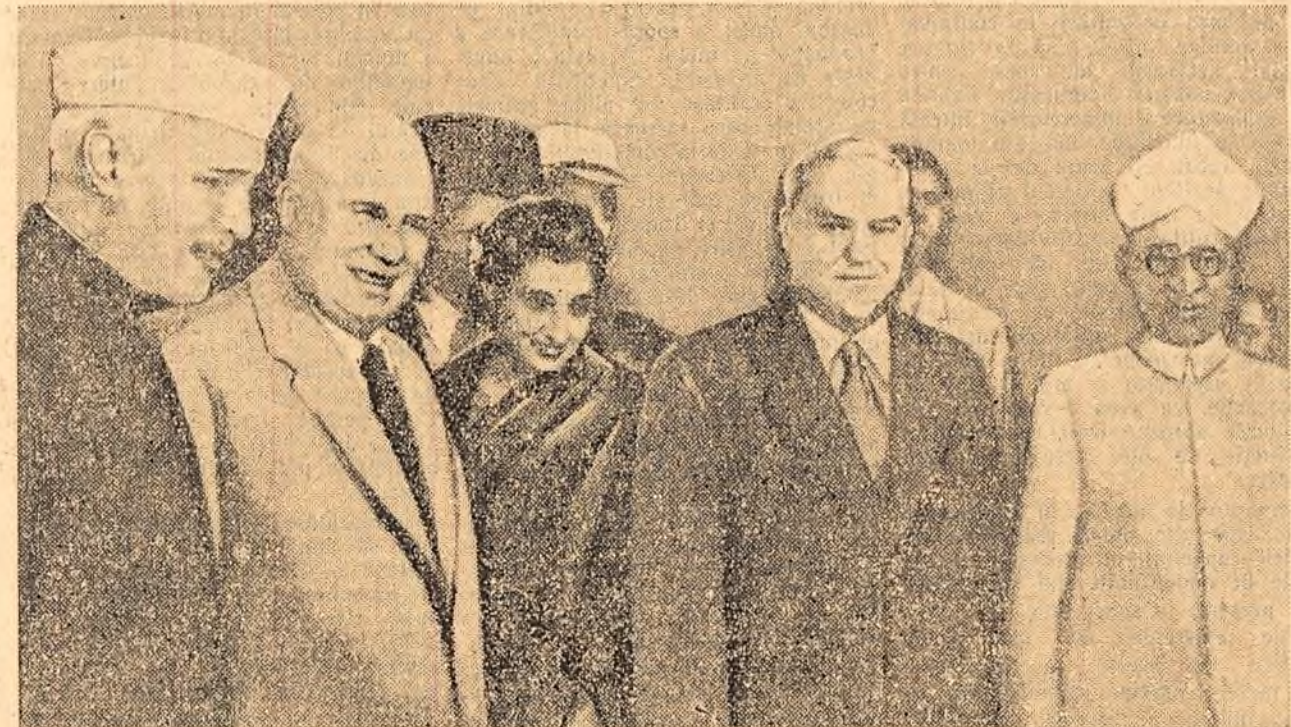
Sosirea la Delhi a lui N. A. Bulganin, președintele Consiliului de Miniștri al U.R.S.S., și N. S. Hrușciov, membru în Prezidiul Sovietului Suprem al U.R.S.S.