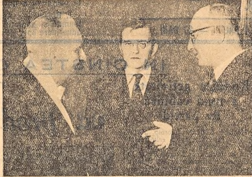
Redeschiderea Operei din Viena — puternic avariata în anii războiului și restaurată cu ajutorul Uniunii Sovietice — a constituit un mare eveniment pentru poporul austriac.