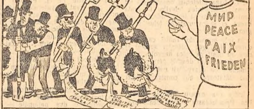
„SPIRITUL GENEVEI” — Calmații-ură, domnilor! Zvonurile despre moartea mea, pe care le răspîndiți, sînt mult exagerate. (Desen de B. EFIMOV din revista „Timpuri Noi”)

Am nutrit aceste iluzii timp de cinci ani. Le mai nutrim și în prezent. Rezultatul este impasul și cît timp va dura aceasta, timpul va lucra în favoarea războiului.”