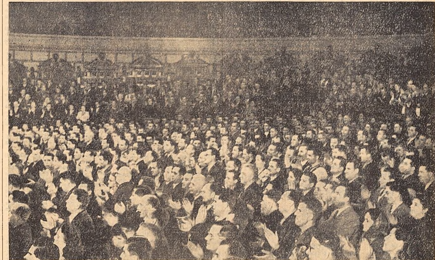
La sfîrșitul lucrărilor celui de-al II-lea Congres al P.M.R., participanții și-au exprimat, printr-o manifestare entuziastă, dragostea și încrederea față de partid și de Comitetul său Central. Ei au acclamat îndelung în cîntec Congresului, care a trasat programul de muncă și de luptă pentru noi victorii în construirea economiei socialiste, pentru întărirea statului democrat-popular.