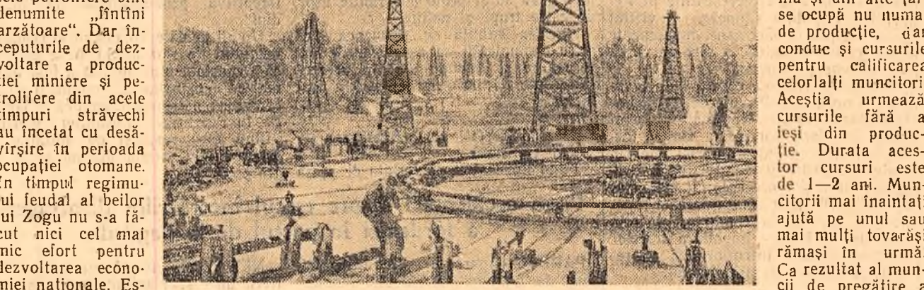
În împrejurimile Orașului Stalin se înalță noi și noi sonde.

Perspectivă și mai luminoasă de viitor se deschid pentru Orașul Stalin — primul oraș petrolifer al Albaniei. Perspectivă mare se deschid pentru întregul popor al Albaniei — străvechea „țară a vulturilor de munte” — care a pașit pe calea unei adevărate renașteri naționale.