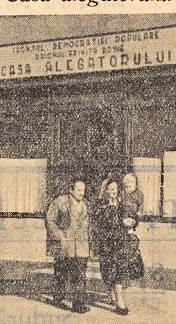
Zilele acestea, în raioanele Capitalei ca și în alte orașe din țară s-au deschis Case ale alegătorului. Numeroși cetățeni vin la aceste case să ceară lămuriri în legătură cu prevederile Decretului pentru alegerile de deputați în sfaturile populare ce vor avea loc la 11 martie a. c., citesc broșuri sau participă la convorbiri cu agitatorii.

În clișeu: Casa alegătorului din Calea Griviței nr. 448.