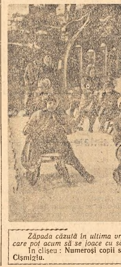
Zăpada căzută în ultima vreme a umplut de bucurie pe copii, care pot acum să se joace cu săniuțele. În clișeu: Numeroși copii se avîntă cu săniuțele pe aliele din Cîsmigiu.