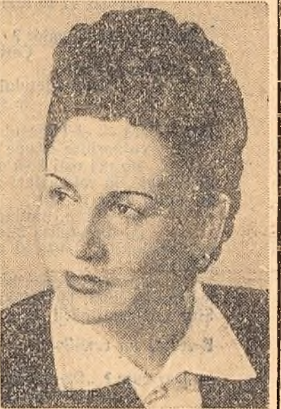
Ana Talmaceanu-Dinescu artistă emerită a R.P.R., laureată a Premiului de Stat, candidată a F.D.P. în circumscripția electorală orașenească nr. 164 București.