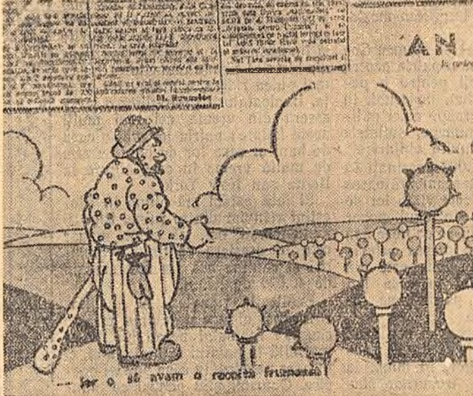
O vorbă din bătrîni glăsuiește: „Ce semeni, aceea culegi”. Iată o caricatură din presa vremii, semnată de I. Ross, care arată că această zicală înțeleaptă poate fi pe deplin legată și de alegerile din trecut. Semnînd ghoage, mardelașii culeguseră drept recoltă succesul în alegeri al comului X sau Y. Recolta de voturi era însă precedată — inevitabil — de o bogată recolta de... capete sparte și de volanți trecuți pe lumea cealaltă...

73; ziaristi și publicisti — 17; (nota bene: dacă moșterul sau industriașul posedă și un titlu, era înregistrat la rubrica „avocați”, „medici” etc. De ex. „doctorul” Angelescu, „profesorul” Mironescu etc.). În Parlamentul anului 1934, avocați — 44,7%, bancheri, industriași și mari comercianți — 26,7%.