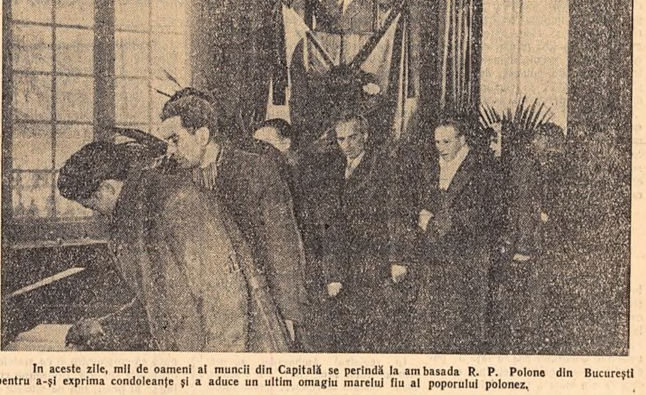
În aceste zile, mil de oameni ai muncii din Capitală se perindă la ambasada R. P. Polone din București pentru a-și exprima condoleanțele și a aduce un ultim omagiu marelui fiu al poporului polonez.