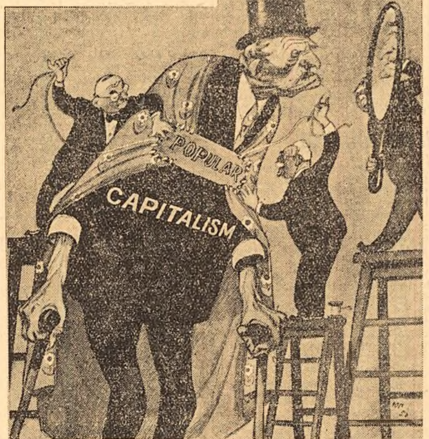
(Din revista sovietică „Krokodil”).