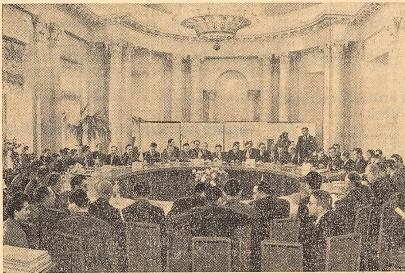
Participanții la conferință în sala de ședințe a Academiei de Științe a U.R.S.S.