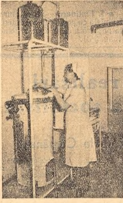
Zilele trecute a fost dat în folosință noul spital din centrul muncitoresc „Lucăcești-Zemes, raionul Moinești. Noul spital cuprinde secții de chirurgie, interne, obstetrică, ginecologie etc.