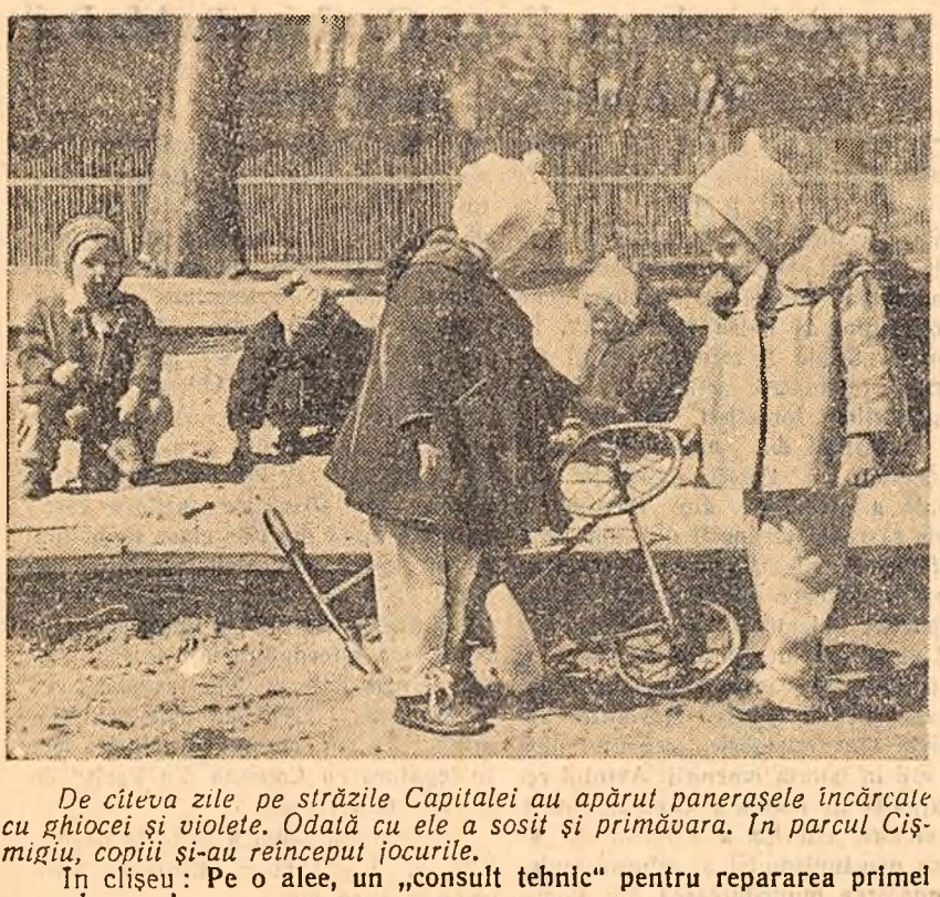
De cîteva zile pe străzile Capitalei au apărut panerășele încărcate cu ghiocei și violete. Odată cu ele a sosit și primăvara. În parcul Cișmîi, copii și-au reincepud jocurile. În cliseu: Pe o alee, un „consult tehnic” pentru repararea primei pene de cauciu.