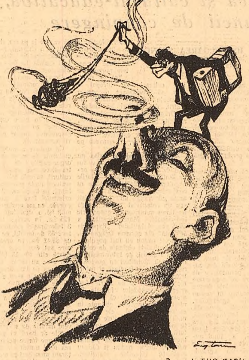
Desen de EUG. TARU