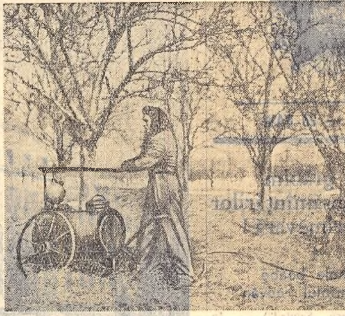
În aceste zile, munca în livezi este în toi. Se fac tăierile de formare în plantațiile tinere, se execută curățirea de uscături și tăierile de fructificare în plantațiile pe rod și se continuă stropirile.

În clipa: La gospodăria de stat Pantelimon, muncitoarele din brigada pomologică a secției a II-a hortiviticole execută stropirea a doua în plantația de cași.