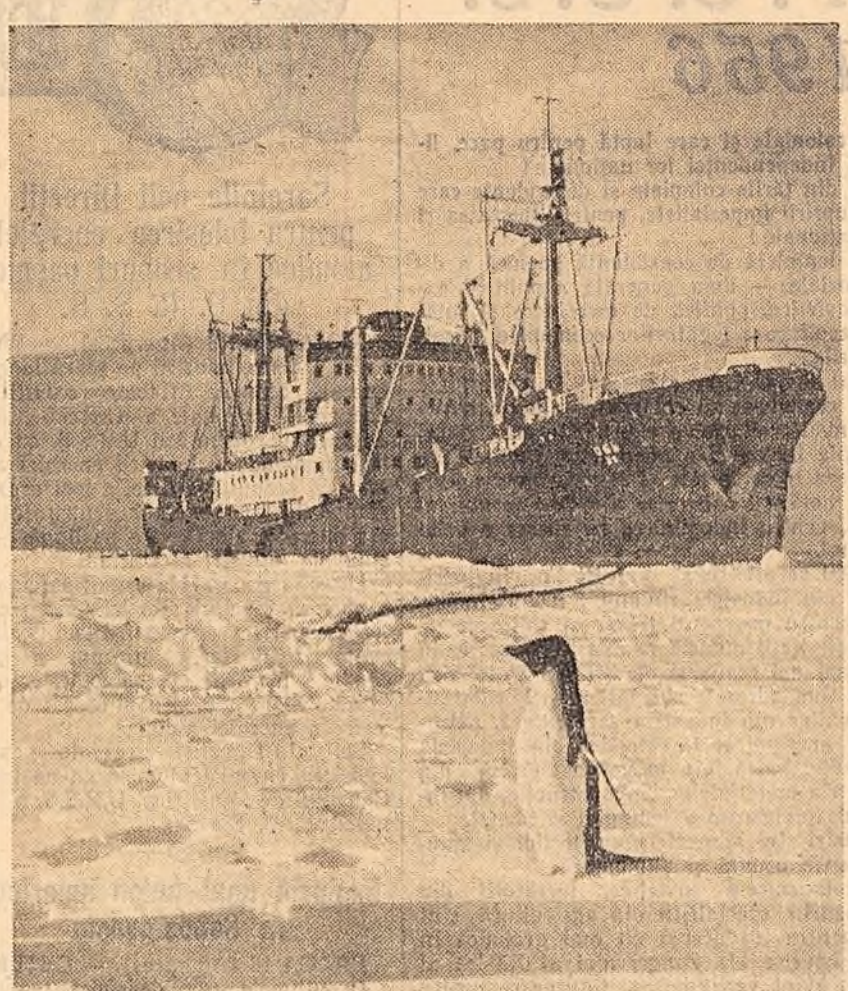
Spărgătorul de gheață sovietic — motonava Diesel „Obi”