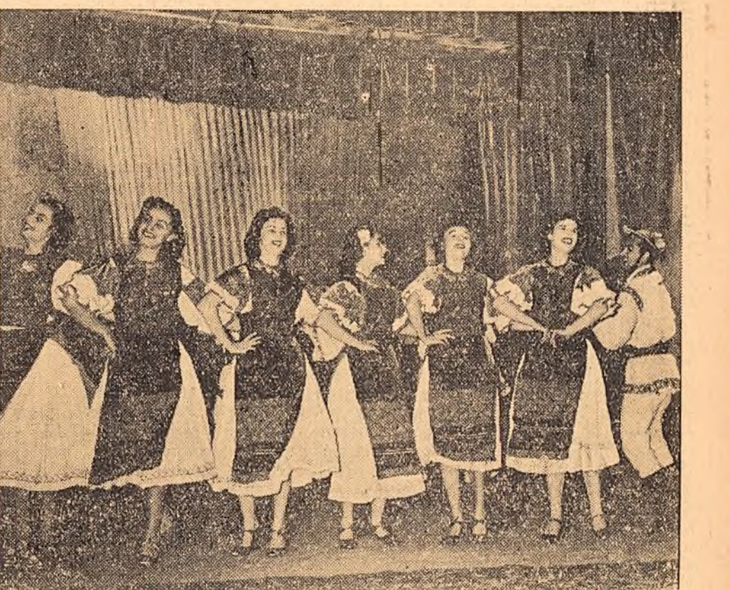
In clișee: (stînga): Oamenii muncii din orașul Galați, manifestînd cu însuflețire, raportează partidului și guvernului succesele obținute în întrecere; (dreapta): Dans popular prezentat pe scena sălii Excelsior din București.