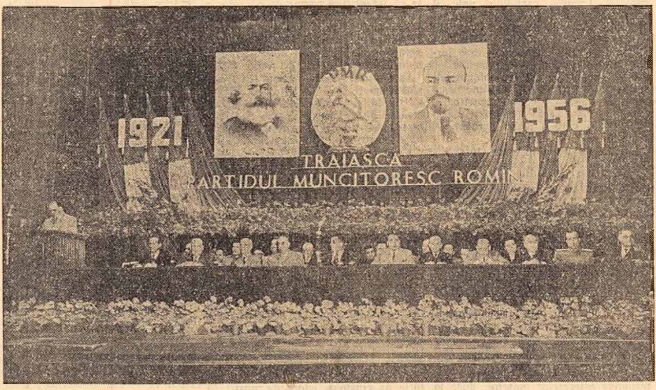
În clișeu: Prezidiul adunării festive.

Adunare festivă organizată de Comitetul orașenesc București al P. M. R.