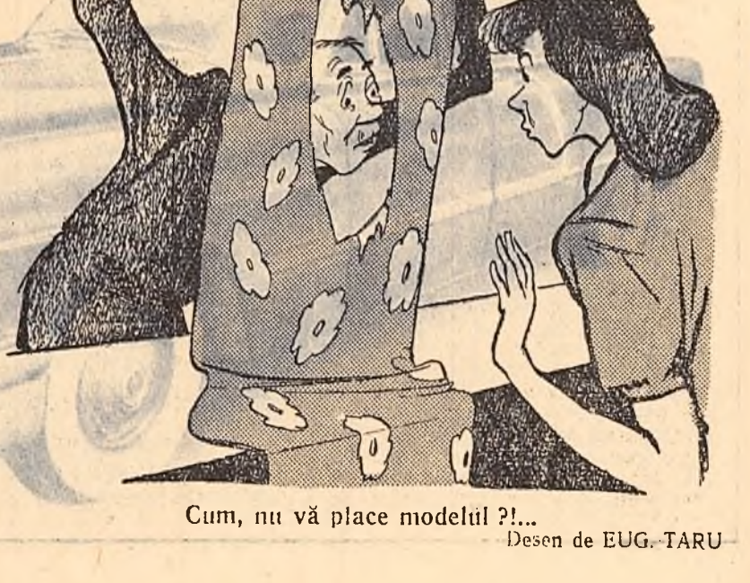
Cum, nu vă place modelul?!... Desen de EUG. TARU

În unele deprinderi și magazine se observă o insuficientă grijă pentru păstrarea mărfurilor în bune condiții.