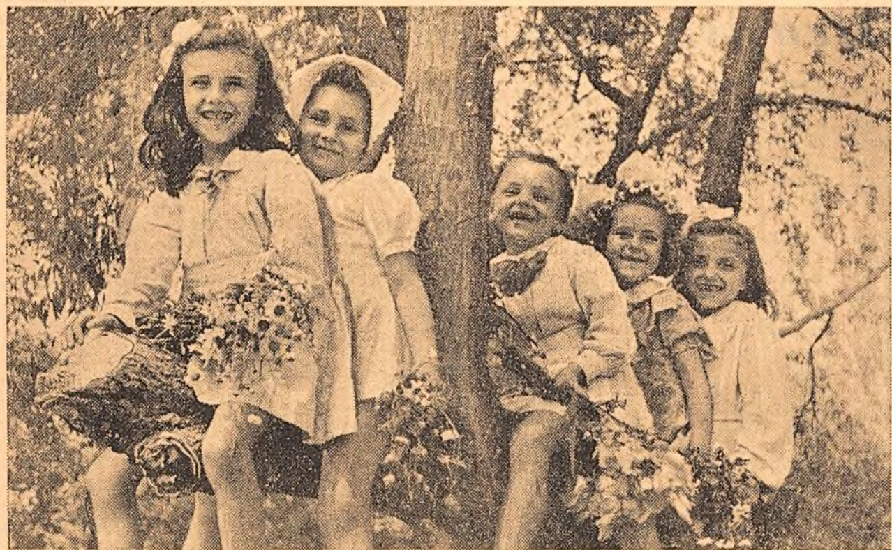
Veselia, joacă, voie bună... Excursiile în păduri și parcuri fac parte din programul de întărire fizică a copiilor din patria noastră. În clișeu: Un grup de copii preșcolari din raionul Grivița Roșie din București într-o excursie în pădurea Mogosoaia.