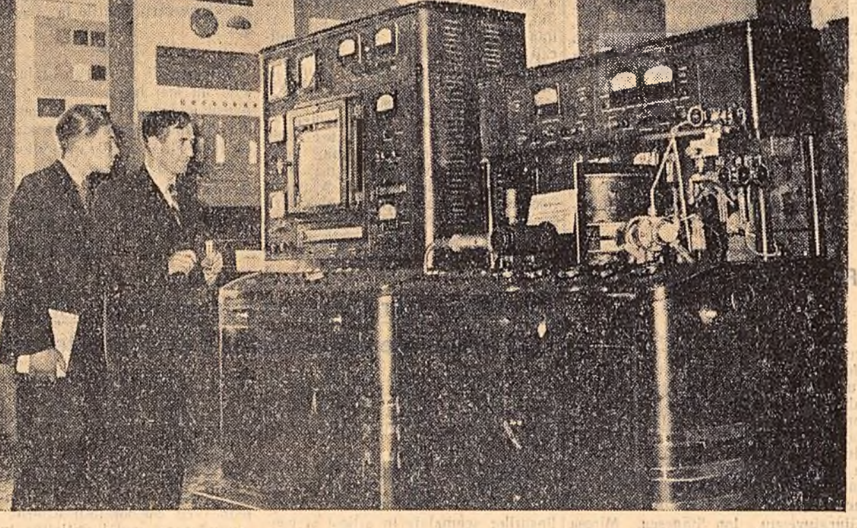
Zi de zi, pînă seara tîrziu, domnește o mare animație în pavilionale Expoziției industriale unio-nale de Moscova...