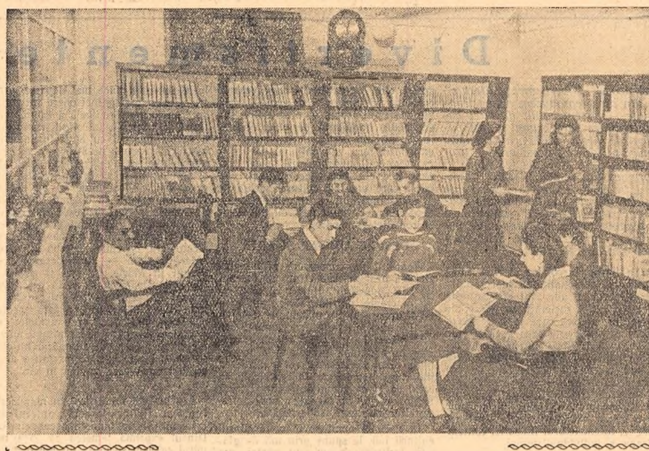
Credincioșii prieteni ai cărții de la uzinele Clement Gottwald se întinlesc deseori, după orele de muncă, în sala de lectură a bibliotecii. În tovarășia oronului erou de roman sau adincind diferite probleme tehnice, ei petrec câteva ore plăcute.

Se știe că aspirația oricărui scriitor este de a se depăși mereu în creația sa. Se poate spune că realizarea acestor aspirații necesită o muncă atât de stăruitoare și de intensă încât nu odată se întimplă scriitorului să fie lipsit aproape de tot de bucuria imediată a creației.