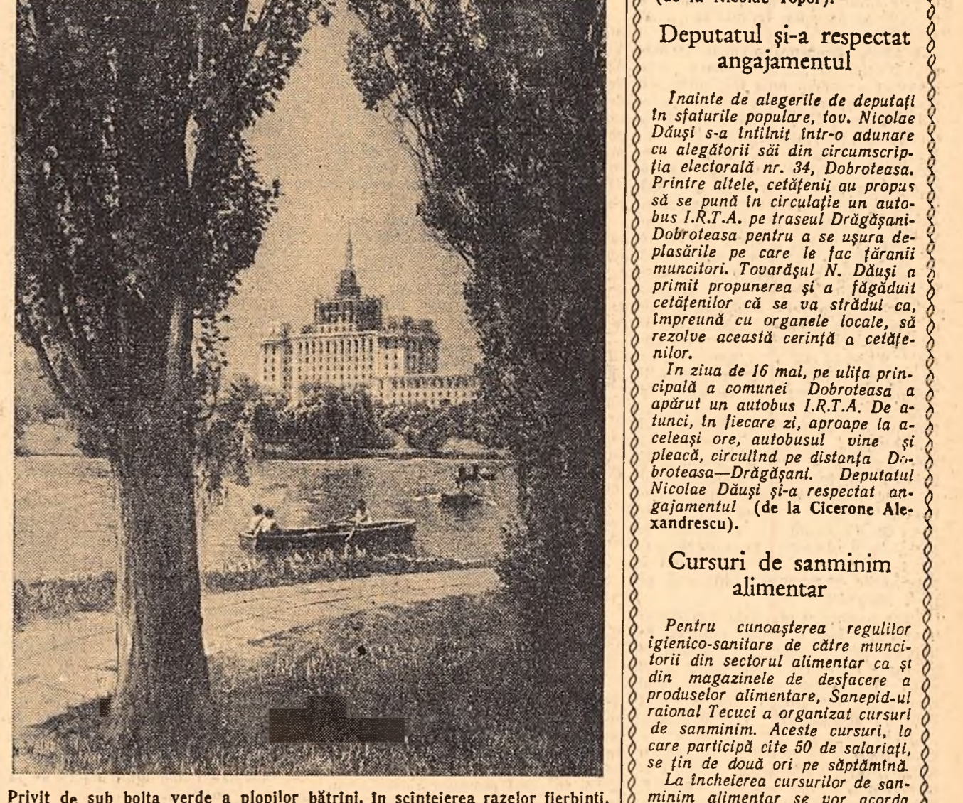
Privit de sub boltă verde a plopilor bătrîni, în scinteierea razelor fierbinți, lacul Herăstrău capătă o nouă frumusețe; pe întinsul lui, amatorii plimburilor cu barca admiră natura înconjurătoare.