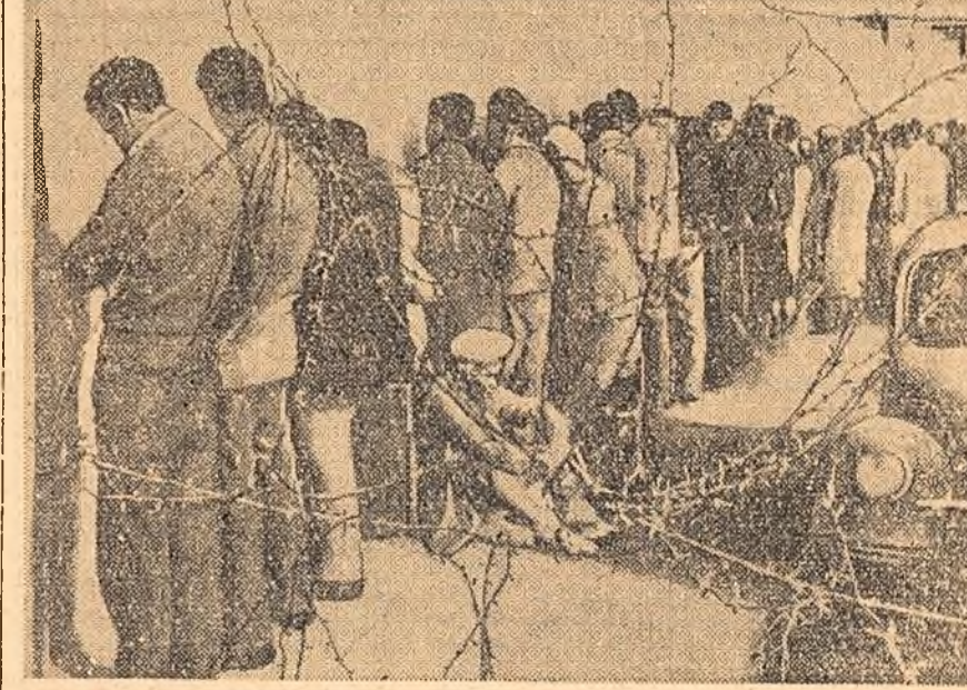
O mare operațiune de „curățire” a fost efectuată zilele acestea de către colonialiștii francezi în orașul Oran din Algeria în cursul căreia peste 3.000 de algerieni au fost arestați. În clipșu: Zeci de algerieni așteaptă, liniștiți cu fața la zid, să fie interogați de autoritățile colonialiste.

O colaborare sinceră între Tunisia și Franța, a arătat Bourguiba, este imposibilă atît timp cît Franța încearcă să îmbrîșeze mișcarea de eliberare națională a poporului algerian.