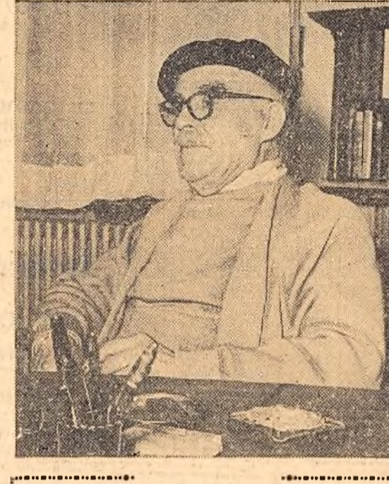
Acad. TUDOR ARGHEZI propus candidat al F.D.P. în circumscripția electorală „Ana Ipătescu” din Capitală.