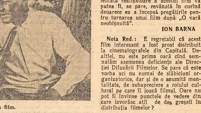
O scenă din film.

Pornind de la acest scenariu, tînărul regizor V. Basov — cunoscut publicului nostru ca unul din realizatorii filmului „Școala curajului” — și-a putut realiza visul de zece ani de a face un film după romanul lui Fedin. Basov a pornit evident de la ideea de a aduce