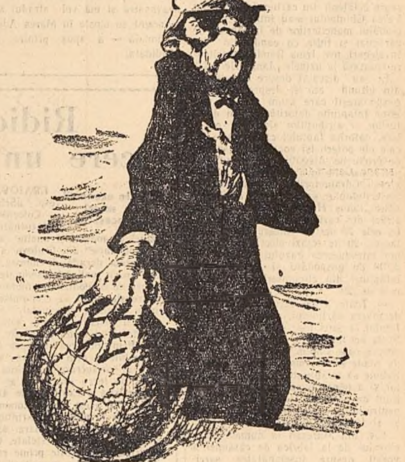
Mania dominației mondiale — It-tografie de Perahim (de la Expo-ziția de gravuri J. Perahim).