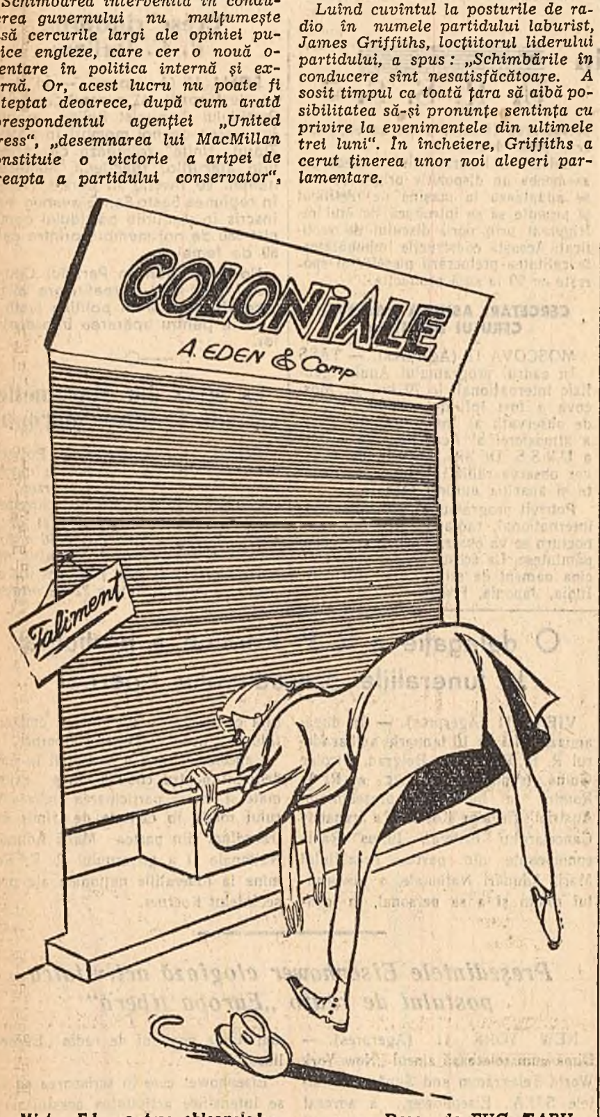
Mister Eden a tras obloanele...

După părerea corespondentului agenției „France Presse” la Londra, numirea lui MacMillan s-ar datoră „influenței personale a lui Churchill și a lordului Salisbury” pe lângă reșina Angliei. Pe de altă parte, unii comentatori americani, ca de pildă redactorul ziarului „Daily News”, afirmă că bunele relații ale noului prim ministru cu conducătorii politici americani au fost un factor determinant în numirea sa. Dacă așa stau lucrurile, îi va fi însă greu lui MacMillan să restabilească relațiile anglo-americane și să apere în același timp interesele sprinjitorilor săi din partidul conservator, amenințate de S.U.A. în Orientul mijlociu. Luând cuvântul la posturile de radio în numele partidului laburist, James Griffiths, locțiitorul liderului partidului, a spus: „Schimbările în conducere sînt nesatisfăcătoare. A sosit timpul ca toată țara să aibă posibilitatea să-și pronunțe sentința cu privire la evenimentele din ultimele trei luni”. În încheiere, Griffiths a cerut țineră unor noi alegeri parlamentare.