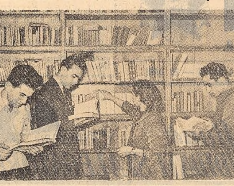
„Ce carte v-ați ales? Ultimul volum de Opere de Sadoocanu, Găzeta Fi-losofice de Lenin, sau Teatrul de Shakespeare? Biblioteca Casei de cul-tură a studenților din Capitală are toate noutățile de curînd scose din-teaururile tipografilor. Ea dispune de 19.000 volume: literatură beltris-tică, cărți ideologice, tehnice, precum și colecții ale unor publicații pe-riodice din țară și strătinate. În clășu: Clășu dintre vizitatorii obișnuiți rasfoind ultimele noutăți literare