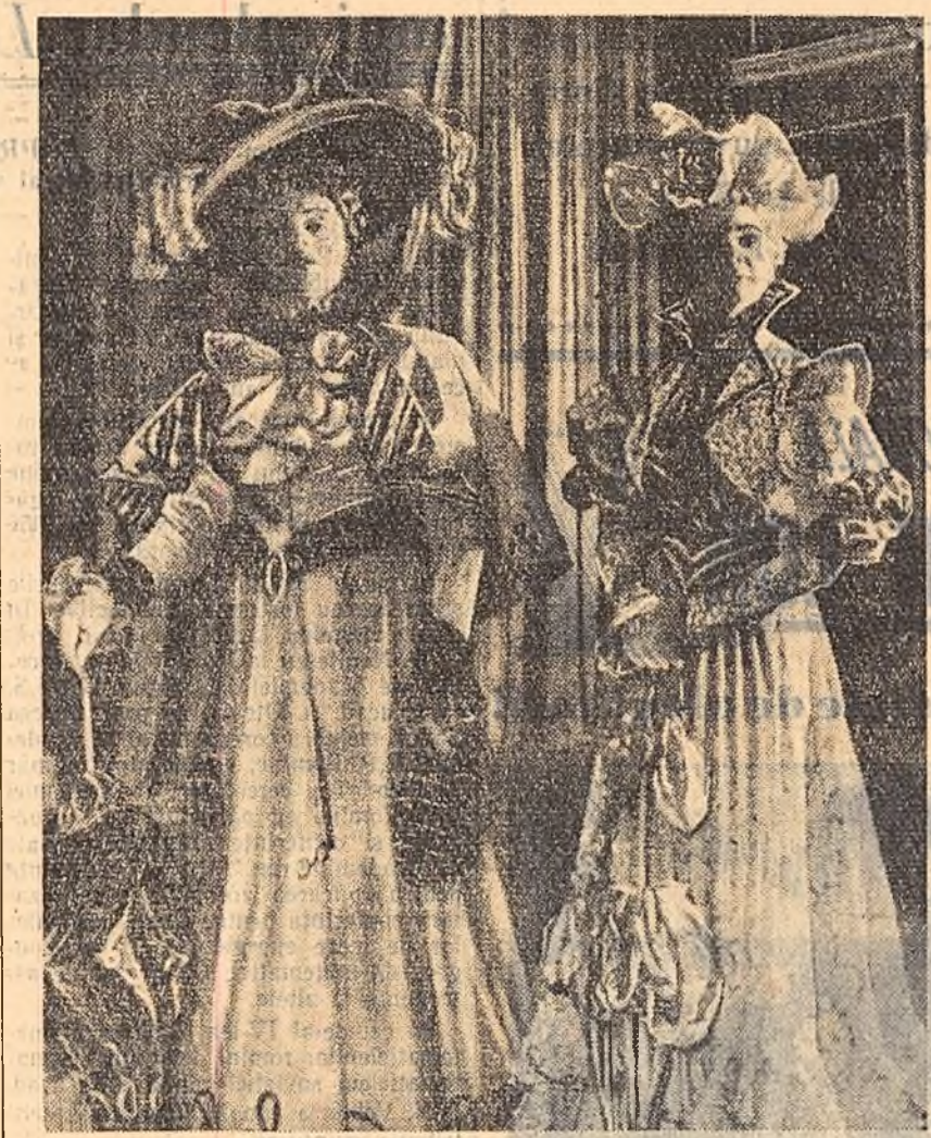
Teatrul Național din Craiova prezintă în Capitală un ciclu de spectacole cu piesa „Bumbury” („Ce înseamnă a fi onest”) de Oscar Wilde. În clișeu nostru: o scenă din spectacol.

Victor Tulbure: Versuri alese E.S.P.L.A.