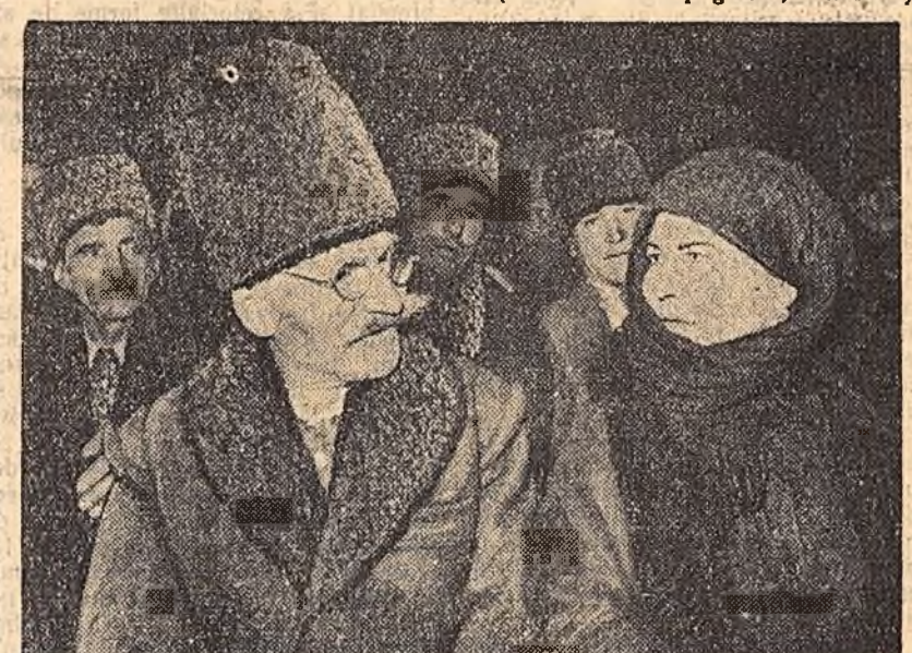
La sfatul bătrînilor din Călărași