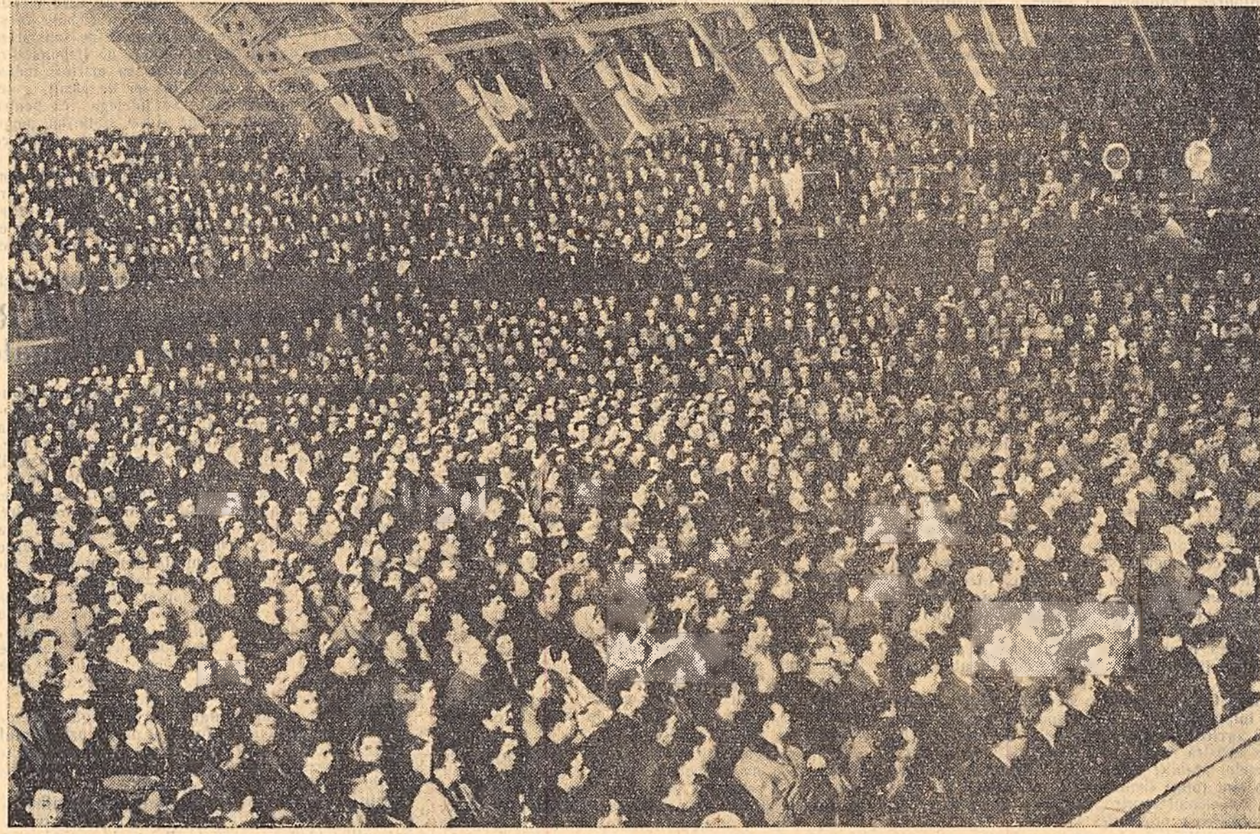
O parte a asistenței la marea adunare populară din sala Floreasca

Iată ce arată întregii omeniri muncitoare experiența noastră și a celorlalte țări socialiste. Marea însemnătate istorică a experienței construirii noi orînduirii sociale în țările socialiste constă între altele în aceea că ea face să crească în ini-