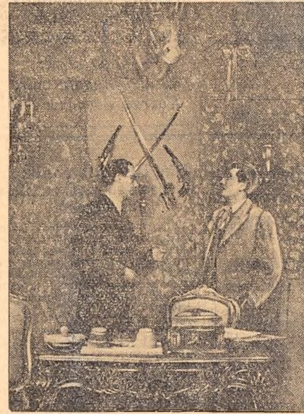
O nouă premieră a Teatrului de Stat din Timișoara — comedia „O MULȚE MIR-TOAGA” de Gh. Ciprian. În fotografie: o scenă din actul IV.