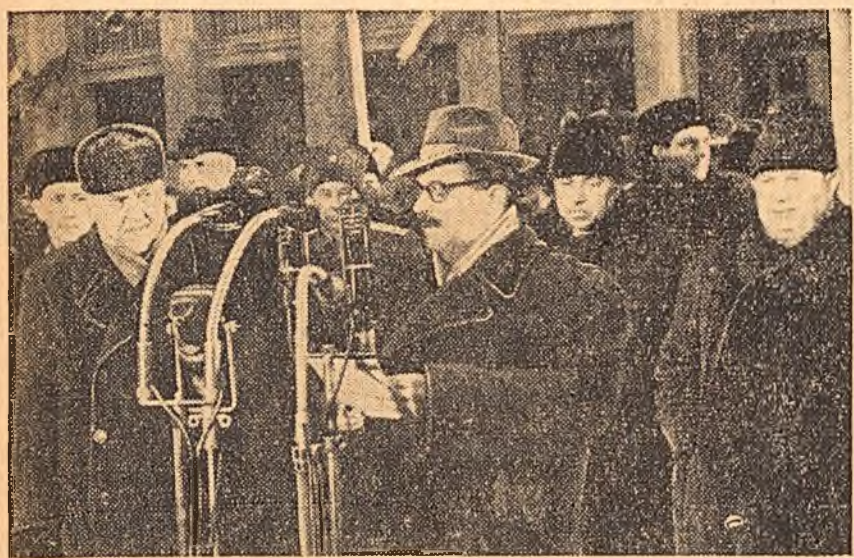
Un aspect de la sosirea delegației guvernamentale bulgare la Moscova

MOSCOVA 16 (Agerpres). — TASS transmite: La 16 februarie au început la Kremlin tratativele dintre delegația guvernamentală a U.R.S.S. și delegația guvernamentală a Republicii Populare Bulgare care a sosit în Uniunea Sovietică într-o vizită de prietenie.