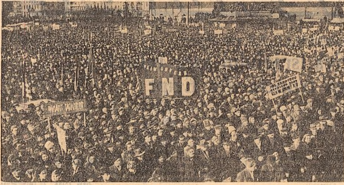
La 24 februarie 1945, la chemarea Partidului Comunist Român, masele largi populare au zdrobit odiosul complot al cuceritorilor imperialiste în complicitate cu regele, cu partidele burgheze reacționare și cu răscălatul fascist rădăcinos împotriva poporului nostru. Urzită sub direcția conducere a ofițerilor anglo-americani de spionaj, complotul urmărea reinstaurarea sabbatice a diktatorilor burghezo-monarhici, restabilirea dominației imperialiste asupra României. Gloanțele călduții rădăcinoase au avut în mijlocul lor o omenie muncii care au împus demisia guvernului trădător al lui Rădescu și instaurarea — la 6 martie 1945 — a puterii democrat-populare, prin aducerea la cârmă țării a primului guvern democratic din țara noastră. Pentru prima oară în istoria poporului român, clasa muncitoare avea rolul conducător în guvernul țării.

Aniversind evenimentele istorice de la 24 februarie 1945, poporul nostru, strins unit în jurul partidului, își exprimă hotărârea de a apăra și dezvolta marile sale cuceriri revoluționare, întărind vigilența împotriva oricăror uneltiri ale dușmanilor păcii și socializmului, consolidind necontenit regimul democrat-popular, expresie a năzuințelor și intereselor vitale ale tuturor oamenilor muncii din patria noastră.