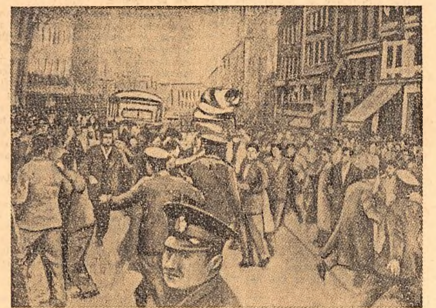
PENTRU ACORDAREA DREPTULUI LA AUTODETERMINAREA CIPRULUI, atît în localitățile de pe insulă cît și în Grecia au avut loc numeroase demonstrații în timp ce la O.N.U. s-a discutat problema Ciprului. În clișeu: o demonstrație a studenților din Atena.