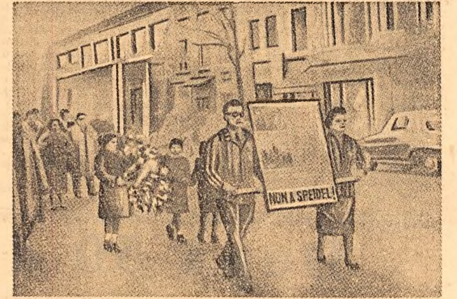
„NON A SPEIDEL!” — sub această lozincă, în Franța, se desfășoară o puternică mișcare de protest împotriva numirii acestui general hilerist într-un post de conducere în N.A.T.O. În clișeu: o demonstrație a patrioților la Paris.