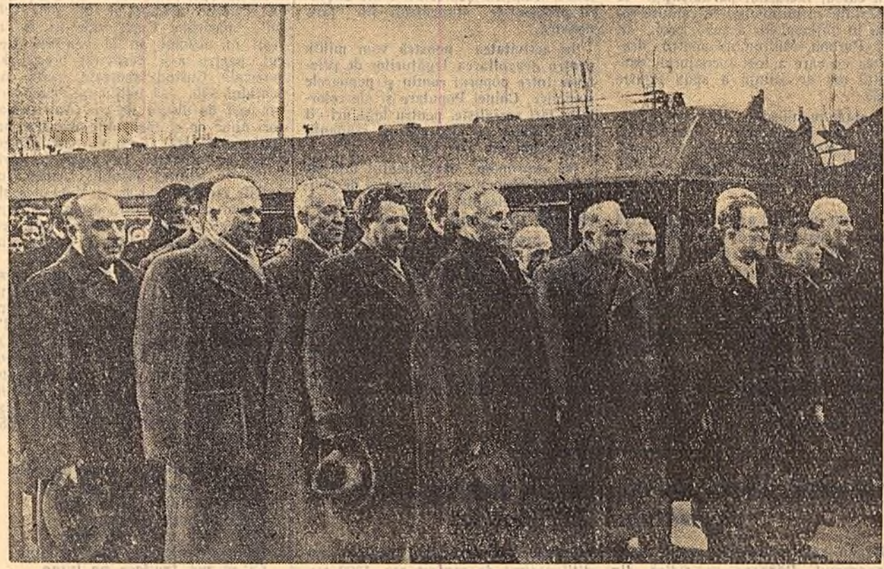
Conducătorii R.P. Bulgaria și R. P. Romine în gara Băneasa în timp ce se întonează imnurile naționale ale celor două țări prietene.

Călduroasa manifestație de simpatie făcută conducătorilor poporului frate bulgar