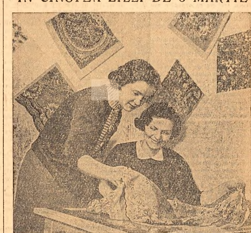
Grumos batic! De mătase născătoare, și ușor! — cîntărește doar nouă batice. Creștea muncitorilor de la fabrica „Cîntărește Doar în Capitală” în cinstea zilei de 8 Martie.

În clădire: Autoarele dinșteia sînt mîndre de noul model de batic, pe care îl vor purta mii și mii de femei...