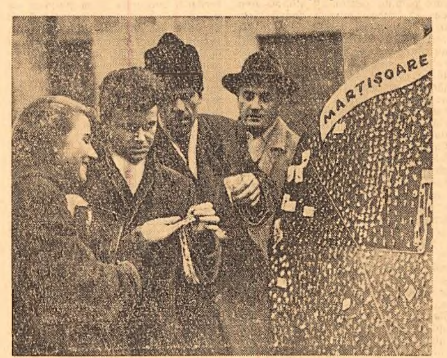
E 1 martie, ziua tradițională mărțișoare, vestitoare ale primăverii. În această zi, milioane de femei primesc acest mic dar ca o dovadă a prieteniei, a dragostei.