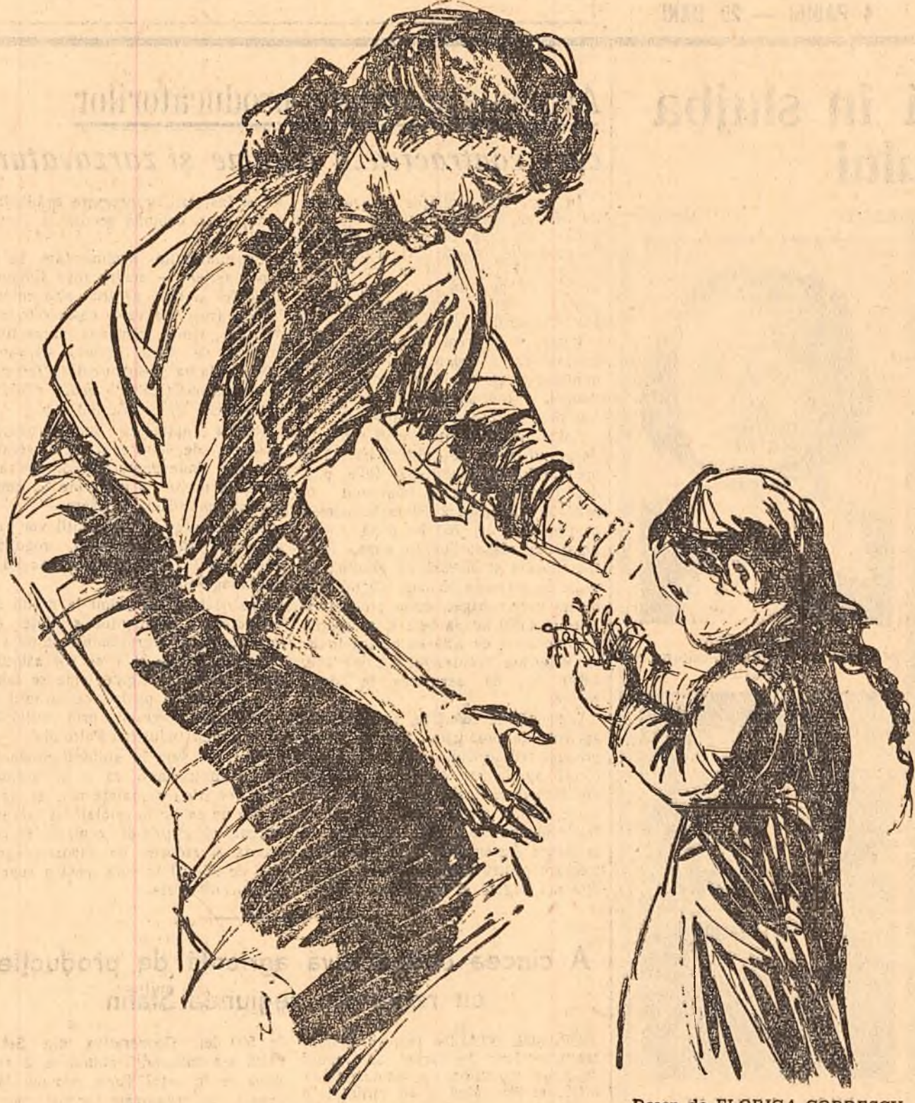
Desen de FLORICA CORDESCU