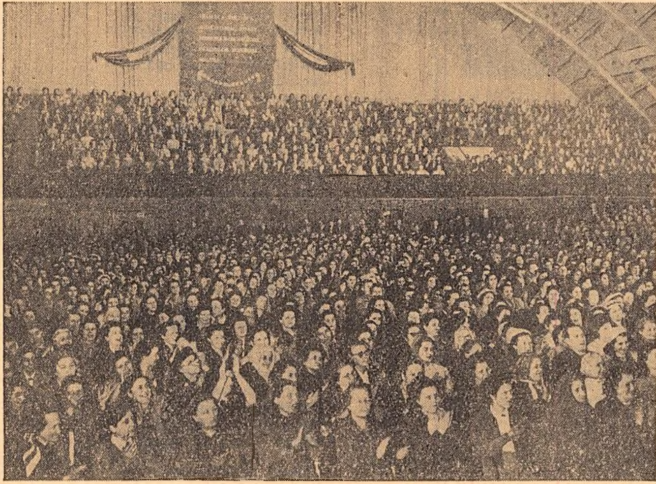
Un aspect de la adunarea festivă din Capitală, organizată de Comitetul Femeilor Democratice din R. P. Romîni, cu prilejul sărbătoririi zilei de 8 Martie.

Vineri după-amiază, în marea sală a Sporturilor de la Floresca, a avut loc adunarea festivă organizată de Comitetul Femeilor Democratice din R. P. Romîni cu prilejul sărbătoririi zilei de 8 Martie — Ziua Internațională a Femeii.