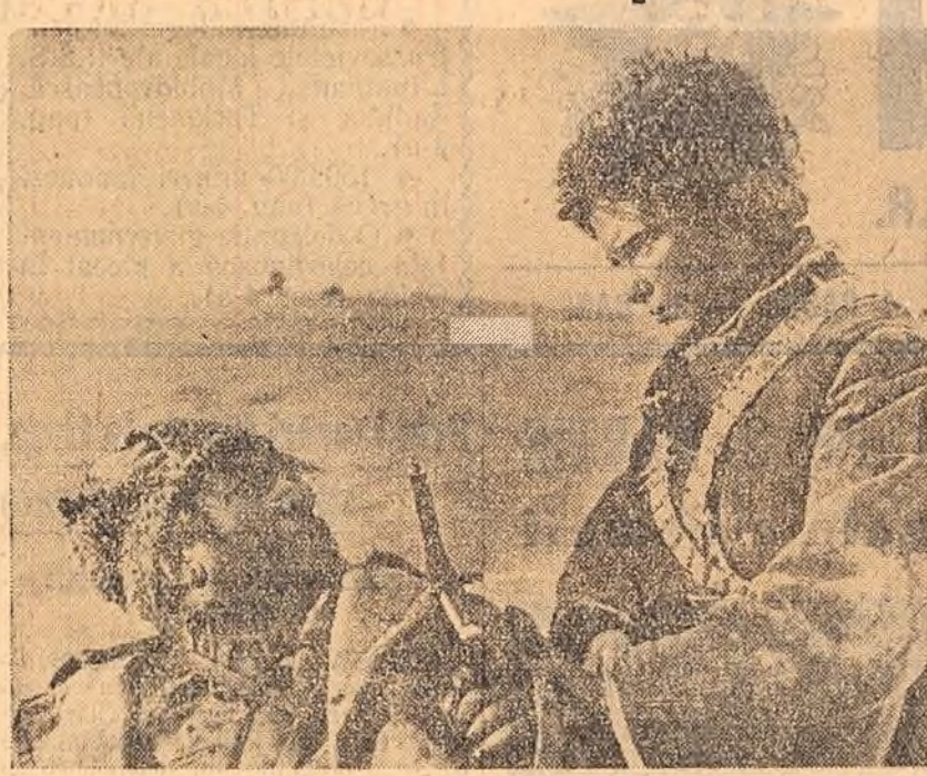
Un puternic film, realizat în culori de Grigori Ciubraj, intitulat „Al 41-lea“, rulează în prezent la mai multe cinematografe din Capitală. Realizat după o năvelă a lui Boris Lavreniev, „Al 41-lea“ înfățișează un episod dramatic din anii Revoluției din Octombrie. În clipșu: o scenă din film