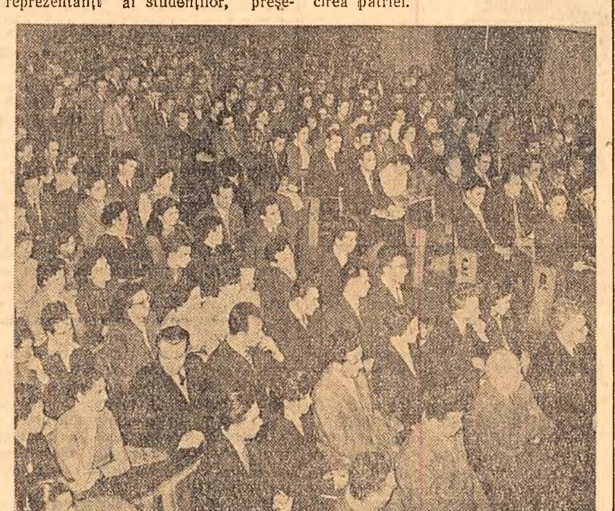
Un aspect din sala în care se desfășoară lucrările conferinței

Comitetul Central al Partidului Muncitoresc Român și Consiliul de Miniștri al Republicii Populare Romine exprimă depina lor convingere și încredere în perspectivele și succesele muncii studențești noastre pentru curcirea cetății științei și pentru fericirea patriei.